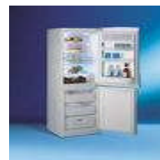
Contributi per frigoriferi

Ai fini del riconoscimento della detrazione il contribuente, dovrà conservare la fattura o lo scontrino recante i dati identificativi dell'acquirente, la classe energetica non inferiore ad A+ dell'elet-